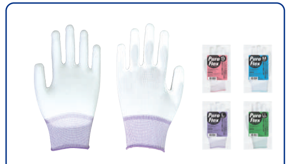
#1300 PU背抜き手袋 プロフレックス

材質：綿100% サイズ：S/M/L 入数：12双×100/箱 オーバーロック：S-緑 / M-白 / L-赤