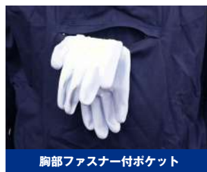
胸部ファスナー付ポケット