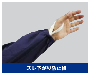
スレ下がり防止紐