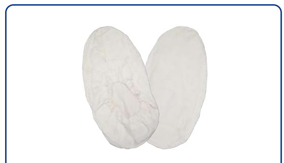
HK-715 綿布シューズカバー(薄手)