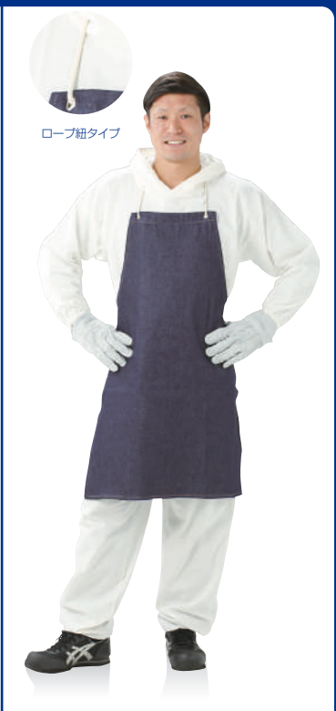
NJ-110P デニムエプロンテープ紐