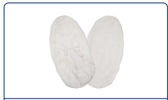
HK-715 綿布シューズカバー (薄手)