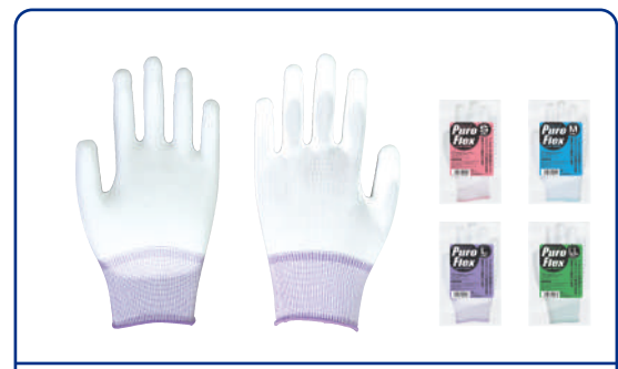
#1300 PU背抜き手袋 プロフレックス

材質：綿100% サイズ：S/M/L 入数：12双×100/箱 オーバーロック：S-緑 / M-白 / L-赤