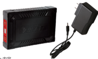
セット内容 バッテリー・充電器