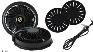
セット内容 ファン×2個・シリコンアタッチメント×2個・ケーブル