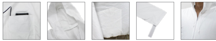
左内側バッテリーポケット 首裏空気調節ひも ペン差し付右脇ポケット マジックテープ裾止め フード部調節ひも